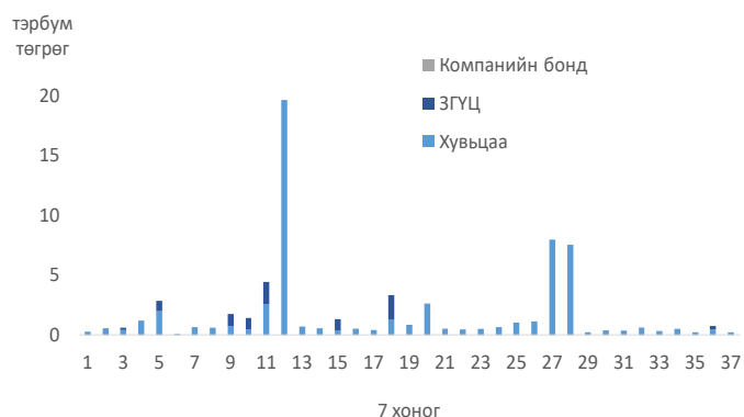
Арилжааны үнийн дүн /7 хоногоор, 2019 он/